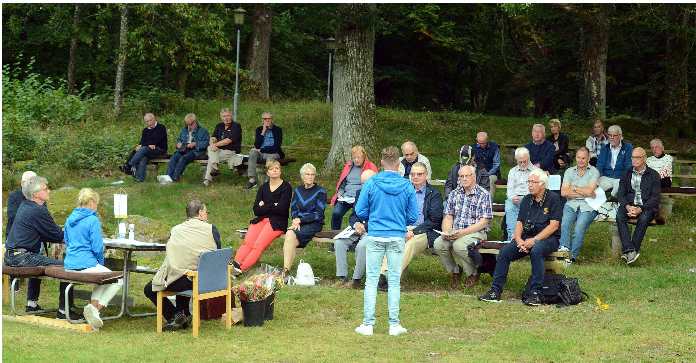
BLIS försenade årsmöte hölls i Hoby Ekebacke, i den sköna naturen, den 15 sep 2020.

Här nedan finns 18 bilder från årsmötet som Torbjörn Sunesson i BLIS tog.