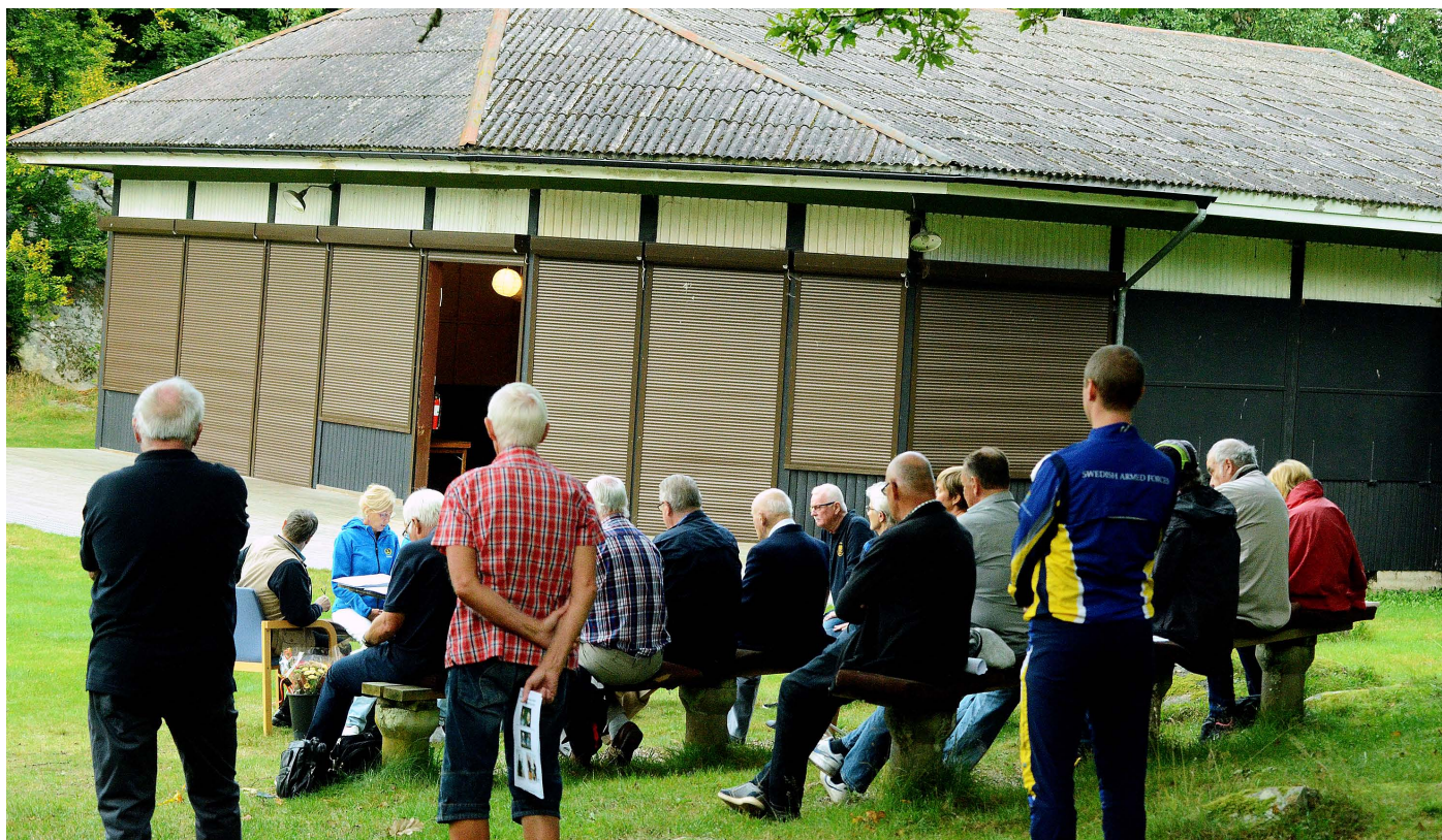
Man kunde sitta tunt klädda under ekarna i den varma septemberkvällen.